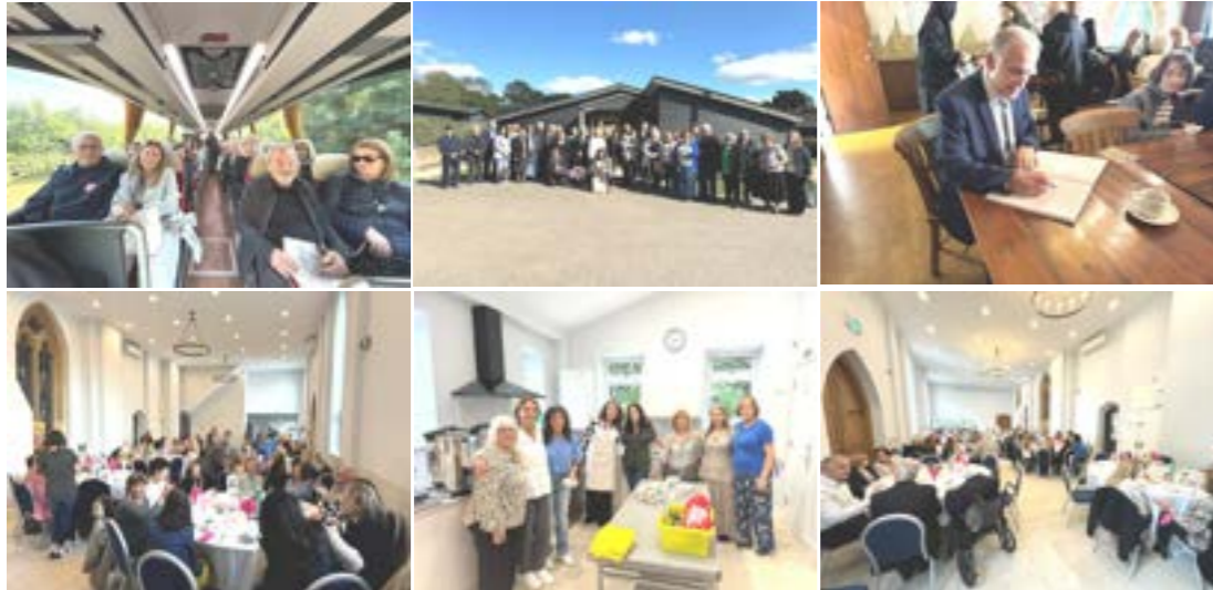
Φωτογραφικό υλικό από την Κοινωνική μας ζωή