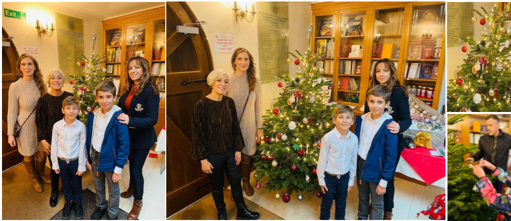
Τα παιδάκια του κατηχητικού με τις δασκάλες τους στολίζουν το Χριστουγεννιάτικο Δένδρο