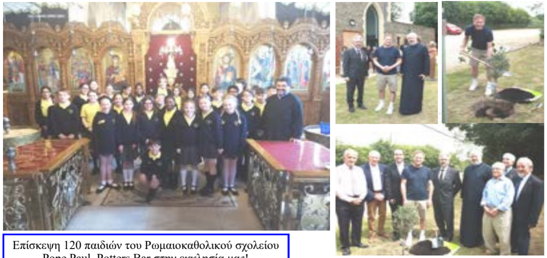
Επίσκεψη 120 παιδιών του Ρωμαιοκαθολικού σχολείου Pope Paul, Potters Bar στην εκκλησία μας! 120 children from Pope Paul Roman Catholic school, Potters Bar at our church!

FORTHCOMING EVENTS ΕΚΔΗΛΩΣΕΙΣ ΤΗΣ ΕΚΚΛΗΣΙΑΣ ΜΑΣ 1. Golden Years Club Lunch - Monday 5th August 2024 at 12pm at our Church Hall. 2. Lunch to be served - Thursday 15th August 2024 after service in Church Hall, £30 per person. Please book in advance by phoning church office. PLEASE KEEP THOSE DATES IN YOUR DIARY!!!