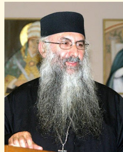
Ούρανό και στη γή.

Τά Άχραντα Μυστήρια, ό λόγος του Θεού και ή προσευχή μεταφέρουν στην καρδιά μας την ένέργεια της Θεότητας και μάς αναγεννοϋν πνευματικά, έτσι, ώστε, με τον ρωπισμό της προσευχής, τη χαρά της επικλήσεως του Όνόματος του Κυρίου και τη δύναμη από τη μετοχή μας στο Μυστήριό Του, να μπορούμε να συνεχίζουμε τα έργα της καθημερινής μας ζωής κατά το υπόλοιπο της έβδομάδας με σταθερή πίστη, δύναμη Αγίου Πνεύματος και τη ζώσα έλπίδα της αιώνιας ζωής και σωτηρίας.