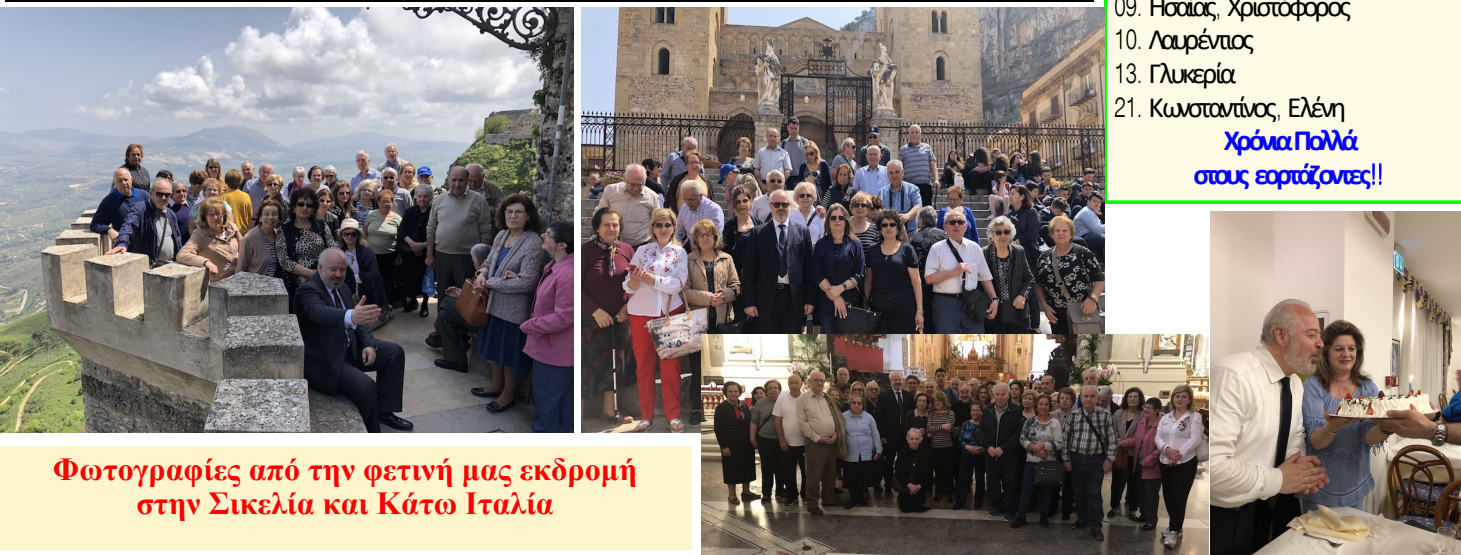
Φωτογραφίες από την φετινή μας εκδρομή στη Σικελία και Κάτω Ιταλία