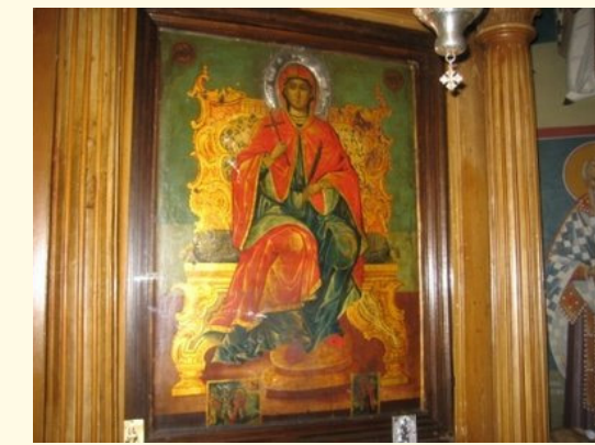
The miraculous icon of St Marina on the island of Andros, Greece